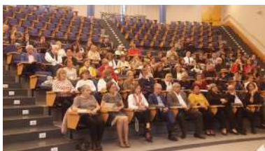
Acto de graduación conxunto dos tres campus o pasado curso, celebrado en Ourense

Promover políticas integrais que favorezan a igualdade de xénero, o principio de Igualdade de oportunidades e a diversidade na docencia e investigación universitaria. Os tres reitores das universidades galegas presentaron este xoves once guías docentes con perspectiva de xénero , editadas orixinariamente en catalán por Xarxas Vives, a asociación que reúne 22 universidades de territorios nos que se fala catalán, e que agora foron traducidas ao galego para pór a disposición da comunidade universitaria galega a través das webs de igualdade das tres institucións de ensino superior galego. +info .