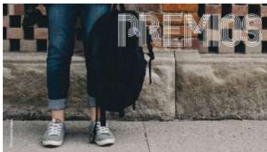
Están convocados pola Vicerreitoría de Responsabilidade Social, Internacionalización e Cooperación

Unha semana antes a que dea inicio de xeito oficial o curso 2020-2021, un ano académico que virá marcado pola crise sanitaria xerada pola covid-19, as diferentes facultades e escolas da Universidade de Vigo reciben ao seu alumnado de novo ingreso. Fano a través da serie de actos benvida programados, desde este luns e ata o vindeiro mércores 23, polos diferentes centros, tanto de xeito presencial, na meirande parte dos casos, como de forma virtual. +info.