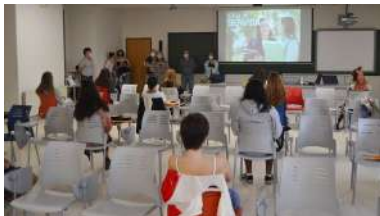
Un intre do acto de benvida celebrado na Facultade de Belas Artes

100% virtuais. Así son os cursos de formación en lingua galega do primeiro cuatrimestre do curso 2020/2021 organizados pola Área de Normalización Lingüística, unha oferta formativa que se compón este ano de seis cursos en liña totalmente gratuítos, que se van desenvolver ao longo dos meses de outubro, novembro e decembro e nos que se inclúen propostas de interese tanto para o alumnado como para o persoal docente e investigador e o de administración e servizos. A matrícula, totalmente de balde, manterase aberta ata o vindeiro día 25. +info.