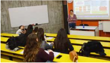
Imaxe da última edición