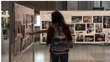
‘Desde dentro’ pode verse desde este luns na planta baixa da facultade.

A sexta edición do Ciclo de Literatura Infantil e Xuvenil que cada ano se celebra no campus de Ourense xa ten data e programación. A cita terá lugar nesta ocasión do 7 de outubro ao 4 de novembro co lema Sen tabús: ler para pensar e nela participarán as e os escritores Fina Casalderrey, An Alfaya, Xavier Estévez, María Canosa e o ilustrador Marcos Viso. Debido á pandemia, as conferencias pasan do formato presencial ao virtual. +info .