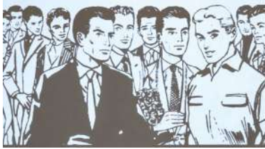
Imaxe de 'Lo que tú digas', de Cristian Gradín, unha das pezas que se analizará no seminario. Imaxe: Cristian Gradín