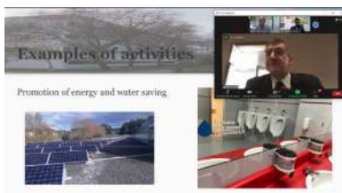
Este debate virtual permitiu dar a coñecer algunha das actividades do Green Campus

Os eventos extremos vinculados ao cambio climático afectan, entre outros moitos sectores, ao da acuicultura mariña, especialmente por perdas de biomasa e danos nas súas instalacións. Estes escapes de peixes da acuicultura en gaiolas mariñas están considerados unha seria ameaza para a biodiversidade natural no ecosistema costeiro, pois os peixes que se escapan poden causar efectos xenéticos indesexables nas poboacións nativas a través do cruzamento, así como efectos ecolóxicos a través da depredación, a competencia e a transmisión de enfermidades aos peixes salvaxes. +info.