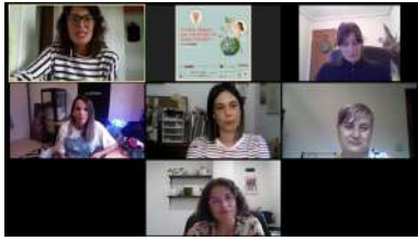
Participantes no coloquio virtual sobre mulleres emprendedoras