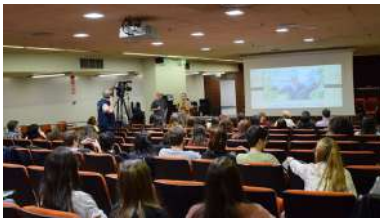
Imaxe de arquivo da anterior edición do ciclo

Como está afectando a pandemia global aos traballos das mulleres e, máis en concreto, ás mulleres emprendedoras? Esa era a pregunta á que tentaron dar resposta as participantes, na noite deste xoves, no coloquio virtual O talento transformador das mulleres emprendedoras , unha das actividades incluídas no programa do Pont-Up Store , o encontro do emprendemento promovido pola Vicerreitoría do campus, a través do Campus Crea, co Concello de Pontevedra, como patrocinador principal. +info .