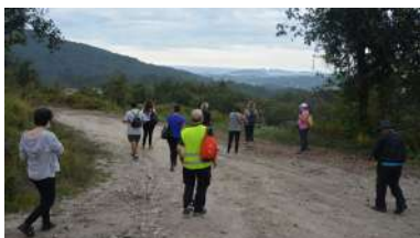
A primeira sesión está a desenvolverse este mes en Gondomar

Un ano máis, o alumnado do campus pontevedrés será un dos protagonistas da xornada inaugural do festival Novos Cinemas , na que se proxectarán as curtas resultantes do obradoiro O ceo a medio facer , no que o director Eloy Domínguez Serén guiará a dez alumnos e alumnas na creación dunhas pezas xurdidas do achegamento ao “cinema en primeira persoa”. Ata o 30 de setembro permanece aberto o prazo de presentación de candidaturas para participar neste obradoiro promovido pola Vicerreitoría do campus e inserido no programa formativo #Aula do festival. +info .