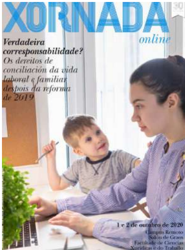
A xornada celebrarase os días 1 e 2 de outubro a través de Campus Remoto