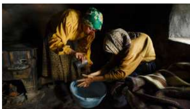
A programación iniciárase o vindeiro luns 21 con 'Honeyland'.

Por terceiro curso académico consecutivo, o campus de Ourense, ao igual que os demais campus da UVigo, súmase á iniciativa Docs del Mes , ciclo de cinema documental que ten como obxectivo achegar o cine documental ao maior número de espectadores e abrirlo a novos públicos proxectando documentais internacionais, de calidade e de temática e procedencia diversa. A programación ata finais de ano en Ourense, froito da colaboración entre a Vicerreitoría do Campus e o Cineclub de Padre Feijóo, constará nesta ocasión de catro proxeccións. +info .