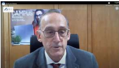
Intervención do reitor da Universidade de Vigo, Manuel Reigosa

A incorporación do concello de Pontevedra dentro das zonas con especiais restricións por mor da covid-19 motivou o adiamento das diferentes actividades presenciais que estaba previsto que, entre o vindeiro xoves 17 e o sábado 19, se desenvolvesen na cidade no marco da sétima edición do Pont-Up Store , o encontro do emprendemento promovido pola Vicerreitoría do campus, a través do Campus Crea, co Concello como patrocinador principal. +info .