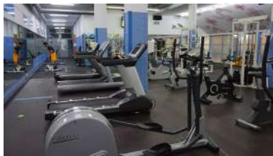
O primeiro usuario da sala cardio-fitness de Vigo

O 2020-2021 será un curso de moitos cambios na Universidade de Vigo froito da experiencia adquirida pola institución para adaptarse á situación de emerxencia da segunda parte do curso pasado. Unha das principais novidades, que estará dispoñible a próxima semana, é un novo portal de teledocencia que substituirá a FaiTic. Bautizado como MooVi, está baseado nunha instalación na nube da última versión dispoñible de Moodle, que é a plataforma estándar dentro das tecnoloxías de software libre no ámbito da teleensinanza. +info .