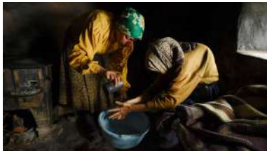
A programación iniciárase o vindeiro luns 21 con 'Honeyland'.